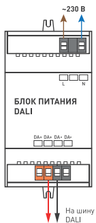
Рисунок 1. Блок питания.