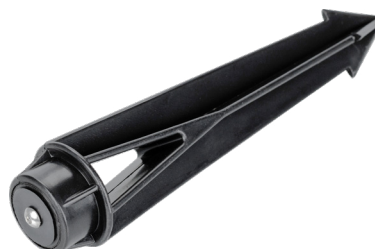
Рис. 3. Основание для установки в грунт (арт. 024888)